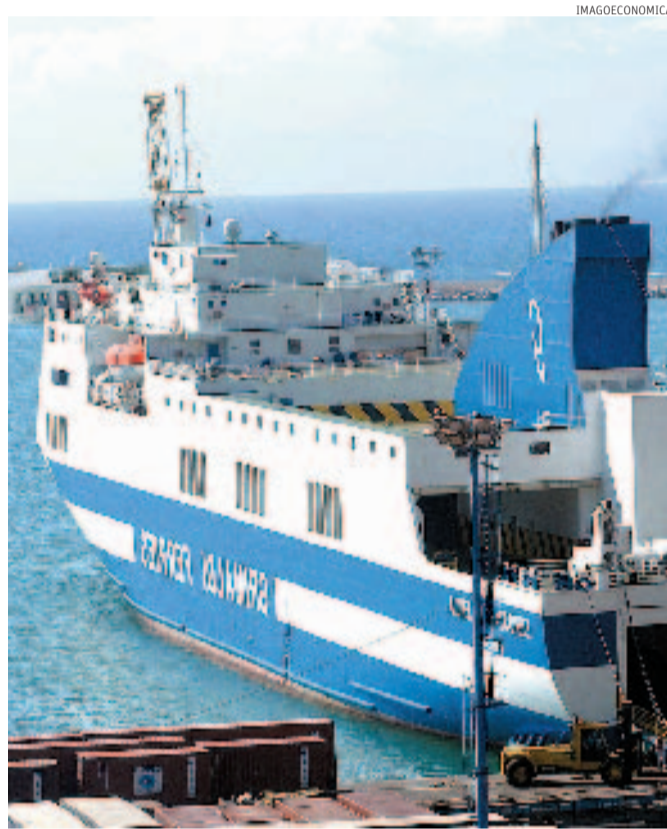
Internazionalizzazione. Operazioni all'estero per il gruppo Grimaldi

In particolare, la nuova società gestirà il collegamento marittimo tra i porti di Livorno e Barcellona. Il servizio è oggi assicurato con cadenza trisettimanale da Grimaldi Lines, marchio del gruppo partenopeo. La joint venture, attraverso l'aggiunta di una seconda nave, dovrà in-