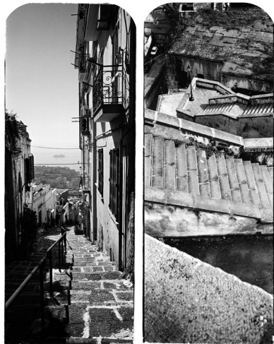
Salita del Petraio